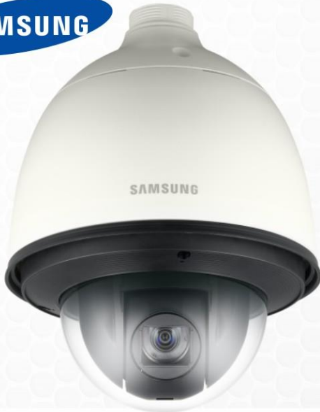
Camara PTZ HD 32X

Cámara de alto rendimiento para su negocio de día y de noche, seguimiento de amplios espacios, con nivel de protección (Ip66) de la lluvia y el polvo. Zoom óptico de 32X, para exteriores.