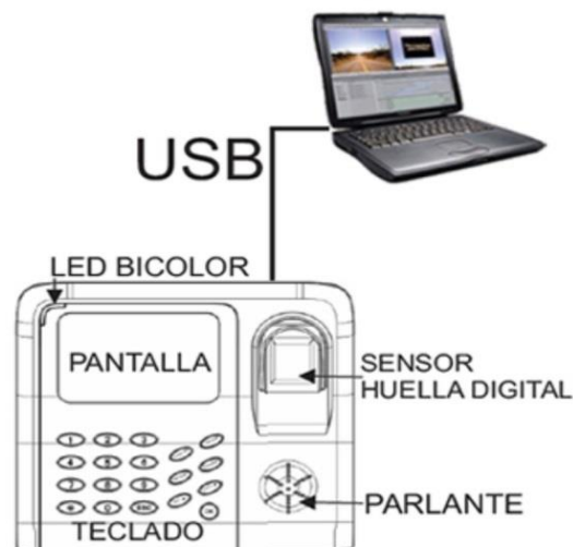
Diagrama de configuración