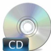
Software de Gestión de Asistencia